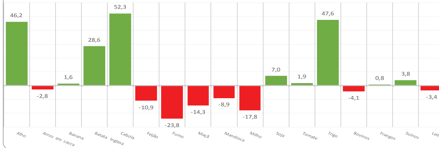
Crescimento (%) na produção agropecuária: 2016/2015